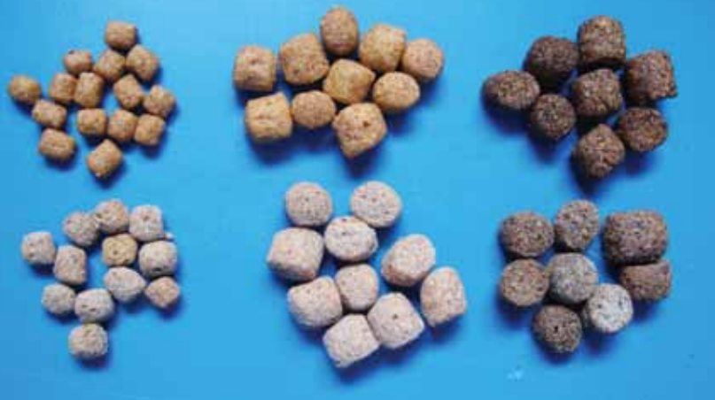
Rações com presença de bolor. Os peletes ficam com coloração pálida e sem brilho, contrastando com a coloração mais viva e brilhante de peletes sem bolor

de coagulação sanguínea. Há um aumento (hiperplasia) dos rins e do fígado. Para aves de corte o limite máximo de fumonisina aceitável nas rações é de 100 mg/kg. Suínos são mais sensíveis à fumonisina, que afeta principalmente o pulmão, o coração e o fígado, ocasionando problemas respiratórios, edema pulmonar e morte. Lesões hepáticas (no fígado) e na mucosa do esôfago ocorrem como sinais de intoxicações sub-agudas, diminuindo o desempenho produtivo (crescimento e conversão alimentar). O limite de fumonisina recomendado nas rações para suínos é 10 mg/kg.