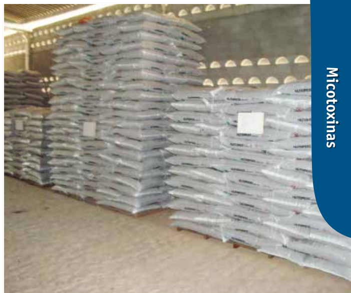
Armazenamento correto das rações, com os sacos empilhados sobre paletes e afastados da parede

Como as micotoxinas podem estar presentes nos ingredientes usados na produção de rações, particularmente os grãos e farelos vegetais, é importante que os fabricantes de ração implementem uma rotina de monitoramento (rastreamento e quantificação) das micotoxinas mais prováveis nestes ingredientes. Embora menos comum, farinhas de vísceras animais também podem conter micotoxinas e seus metabólitos devido à possibilidade de acúmulo dos mesmos nos tecidos e órgãos de animais que consumiram rações contendo micotoxinas. Além do controle da qualidade da matéria-prima, é preciso cuidar da limpeza de equipamentos (moinhos, misturadores, secadores e silos