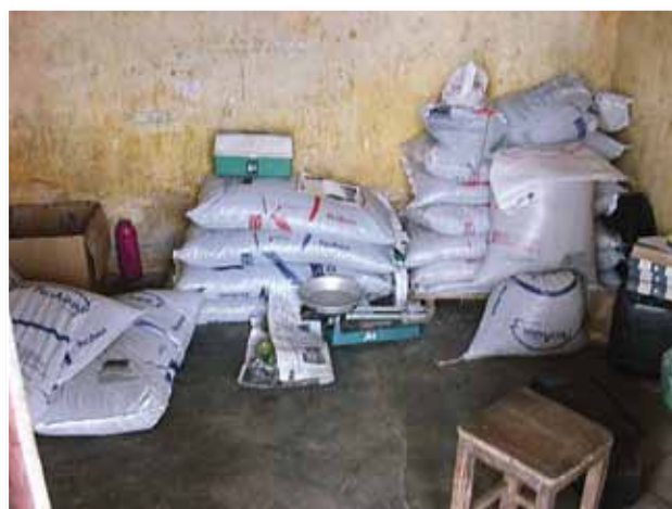
Sacos de ração inadequadamente acondicionados, em contato com o piso e com as paredes do depósito

de armazenamento) de forma a evitar a manutenção de fungos e resíduos de ração contaminados dentro da linha de produção. A adequada secagem da ração é fundamental para minimizar problemas com o desenvolvimento de fungos e acúmulo de micotoxinas na ração. A umidade dos peletes deve ficar abaixo de 13%. A adição de antifúngicos como o ácido propiônico na ração também ajuda a diminuir o desenvolvimento de fungos, principalmente se o produto não foi adequadamente secado ou caso o produto venha a incorporar mais umidade durante o transporte ou armazenamento.